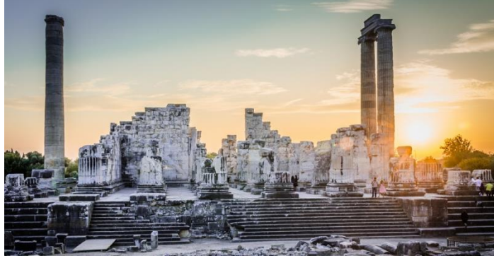
Şekil 4. Apollon Tapınağı, Didim.

Didim 1955 yılından evvel Hisar adıyla anılmıştır. 1955 yılında yaşanan depremlerle beraber insanların geçici evlere taşınması ile beraber ilçe Yenihisar ismini almıştır. Didim ilçesi 1980'li yıllar ile beraber turizm faaliyetlerini arttırmıştır. Bunun doğal etkisi olarak 1990 yılında ilçe olmuştur.