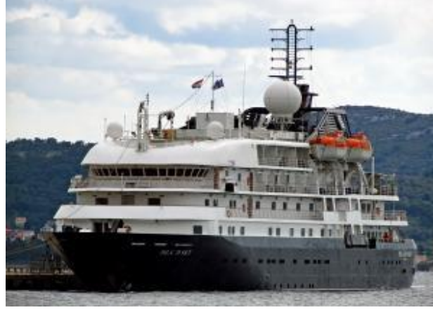
Şekil 6. MS Island Sky Gemisi

Didim'de dalış turizminin geliştirilmesi amacıyla 2011 yılında SG 118 adlı sahil güvenlik botu batırılmıştır (Virahaber, 2011). Bu sayede deniz canlılarına zarar vermeyecek şekilde batırılan tekne dalış turizmi için Panayır adası civarı önemli bir varış noktası olması amaçlanmıştır.