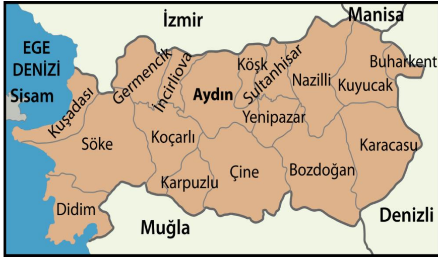
Şekil 1: Aydın İli Haritası

Aydın iline bağlı 17 adet ilçe bulunmaktadır. Kuşadası, Söke ve Didim ilçeleri şekil 1'de görüldüğü gibi denize bakan ilçelerdir. Özellikle Kuşadası ve Didim turizm açısından şehrin önemli varış noktalarıdır. Didim ilçesi Söke ilçesinin parçası iken 1990 yılında merkezi Yenimahalle olan toplamda 11 mahalleye sahip bir ilçe olmuştur.