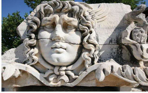
Şekil 5. Medusa Heykeli, Didim.