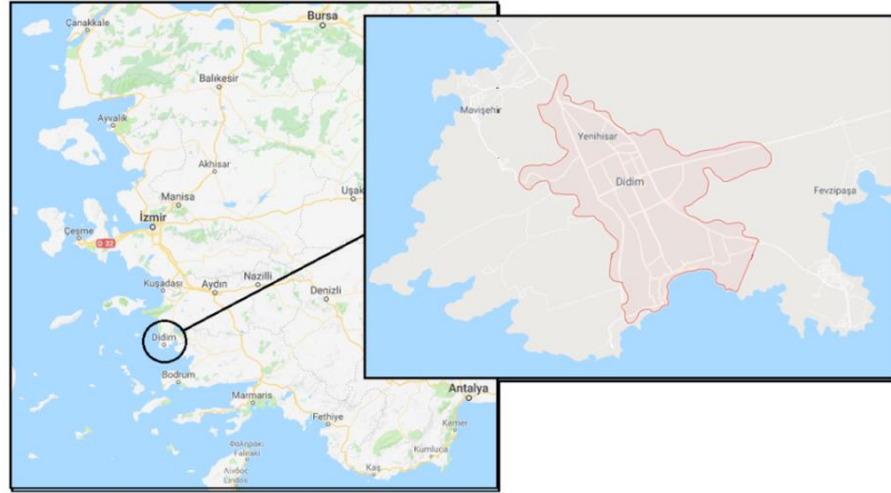
Şekil 3. Didim'in Coğrafi Konumu

Doğal güzelliklerinin yanında antik yerleşim yerlerine yakın olan Didim, güneyden turlar ile Milet'e gidilebilmektedir. Yaklaşık 20 km uzaklıkta bulunan Milet tarihte filozoflar şehri olarak bilinmektedir.