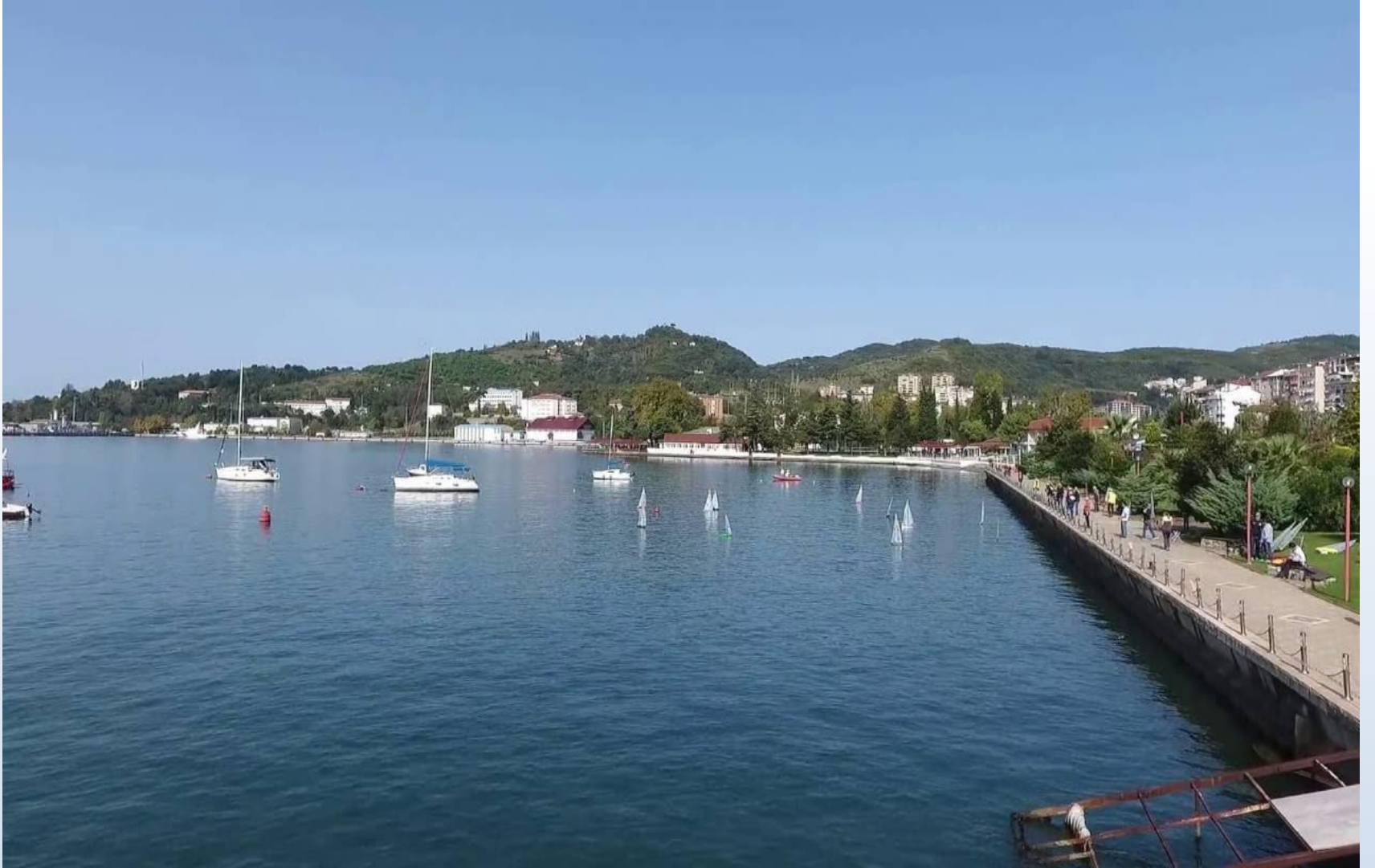
Polis evi ile Donanma sınırı arasındaki bölge