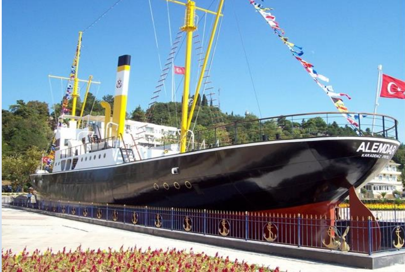
Gazi Alemdar Gemisi Müzesi