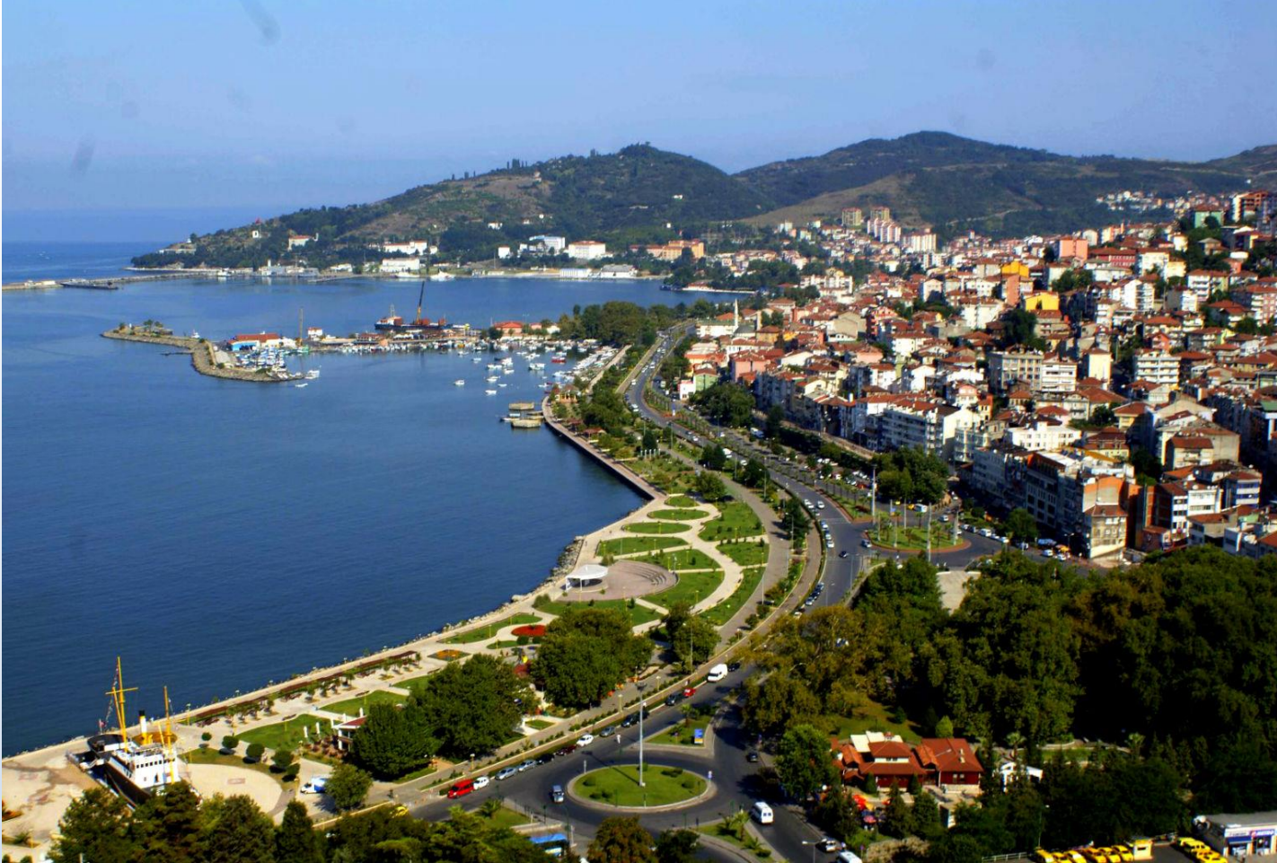
Kdz. Ereğli Sahili Tepeden Görünümü