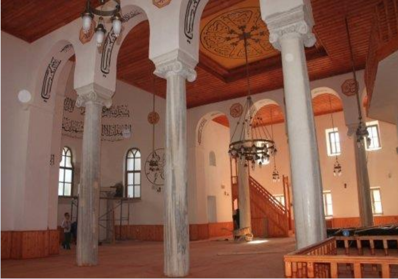
Orhangazi Cami (Ayasofya Kilisesi)