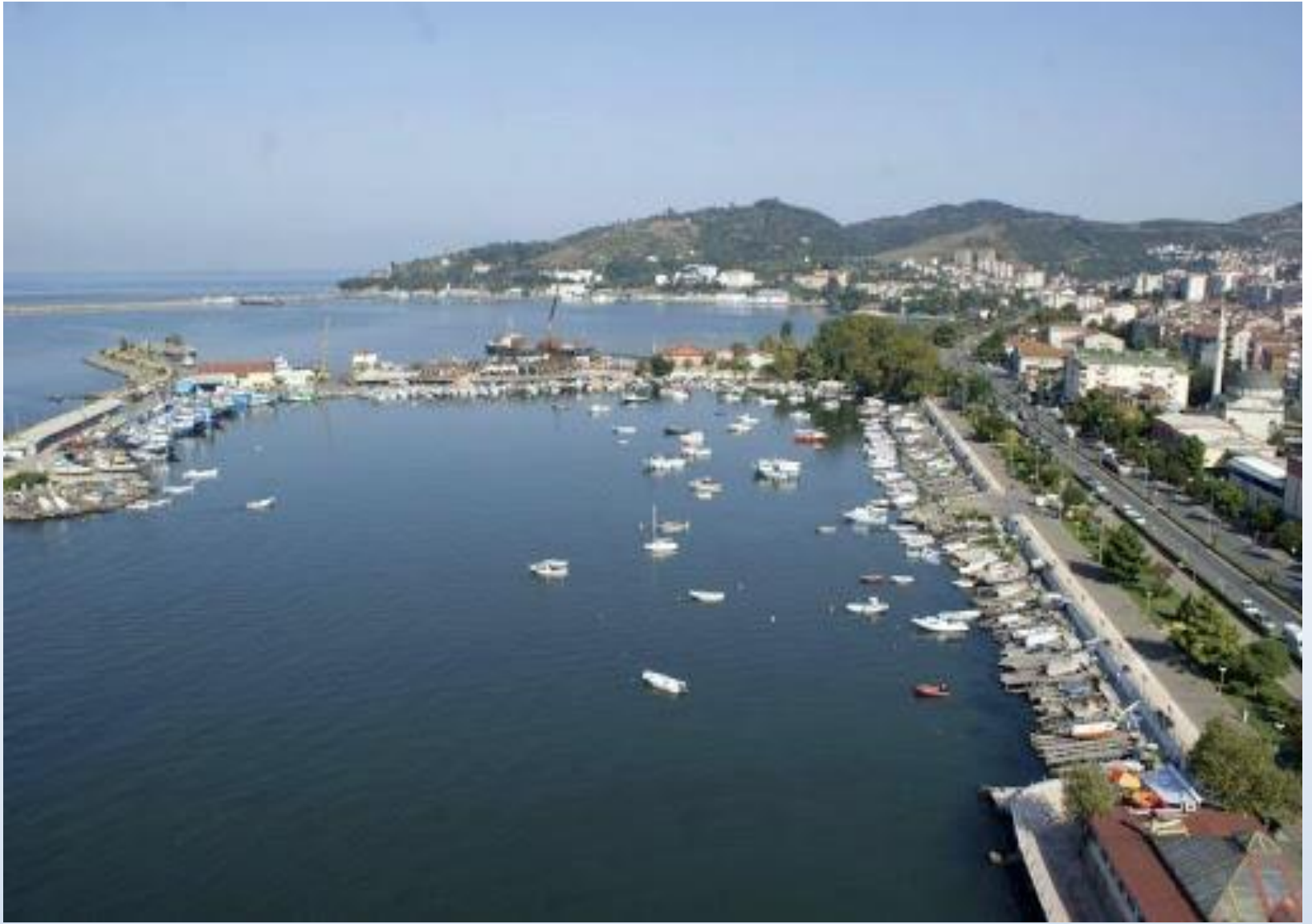
Bozhane Balıkçı Barınağı